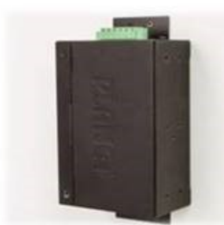
Wall mounting (Space saving)