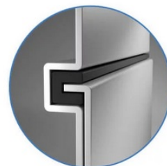
Sealed Lock-and-Key Design

Na zadní straně je k dispozici celá řada portů, mezi nimiž vyčnívá především rozhraní HDMI 2.0 , které zajistí snadné promítání 4K obsahu při vyšším jasu a kontrastu oproti standardnímu rozlišení. Jas je klíčem k viditelnosti. I proto nabízí projektor BenQ LU9245 funkci dynamického tlumení jasu dle scény a optimalizuje světelný výkon a kontrast pro co nejlepší obraz.