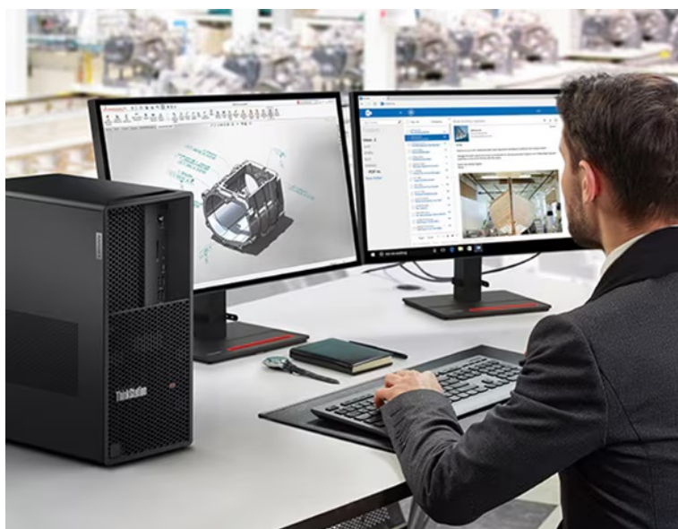
Lenovo ThinkStation P3 Tower