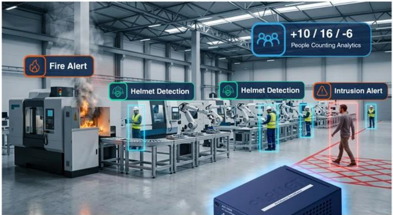
AI Surveillance Station AIS-1000